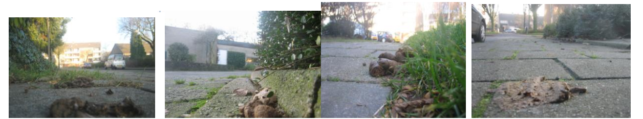
nieuwland w.alexanderweg voetpad > jhr.n.weg trottoir margrietstr.