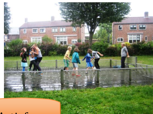
Nieuwland Actief 2013